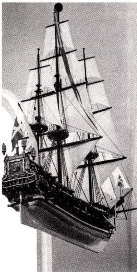
"Dannebrog" i Kerteminde Kirke

Præcis sådan så "Dannebrog" ganske vist ikke ud; skibet er et ældre og mindre fra engang i 1600-tallet, som man ikke ved noget om. Men ligesom i andre af landets kirker, hvor en menighed i 1710 var smerteligt ramt, havde man brug for et synligt minde, og da ingen på Fyn vidste hvordan det forulykkede skib havde set ud, kunne ingen heller protestere imod, at et andet ved navneforandring blev gjort til "stand-in".