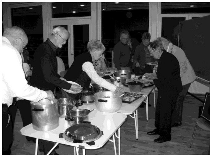
Kødmad, kål og hjemmebrygget øl på bordet ved madaf- tenen i november 2007

Foreningens medlemstal steg stadig. Ved udgangen af 2004 var der 155 medlemmer. Aktiviteten var også fortsat høj med 8 arrangementer om året, og heriblandt nogle ret omfattende udstillingsarrangementer. I 2003 en luftfotoudstilling,