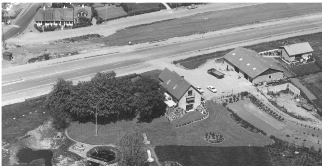
Den nye Fjordgård på sydsiden af amtsvejen, 1963