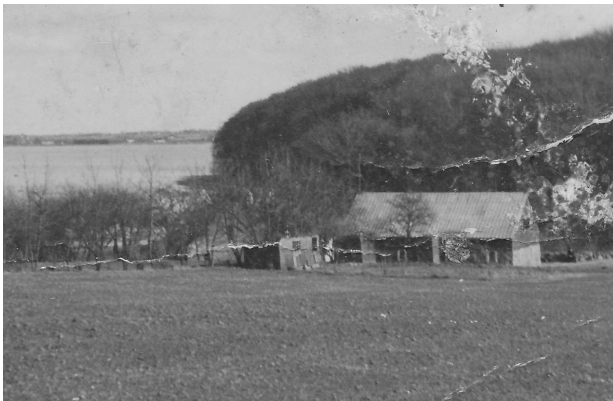
Skyttehuset før ombygning

I forbindelse med udstykningerne i 1922-23 af jord fra Østergård til husmandsbrugene i Trællerup fik ejendommen tildelt et jordareal på knap 5 ha, lidt mindre end de nye ejendomme i området. Udstykningen blev formidlet gennem "Foreningen til Opkøb og Udstykning af Landejendomme i Sjællands og Fyns Stift" (se mere om udstykningen i Arvesølv 2001, s. 22-26).