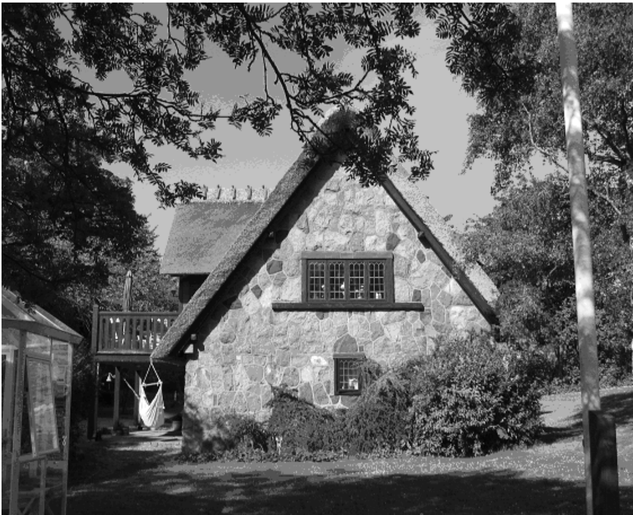
Skyttehusets gavl som den ser ud i dag

3. Landbrugsejendom iflg. Skrivelse af 27.3.1933 fra Landbrugsministeriet. (Min tilføjelse: Heraf følger, at der er landbrugspligt på ejendommen).