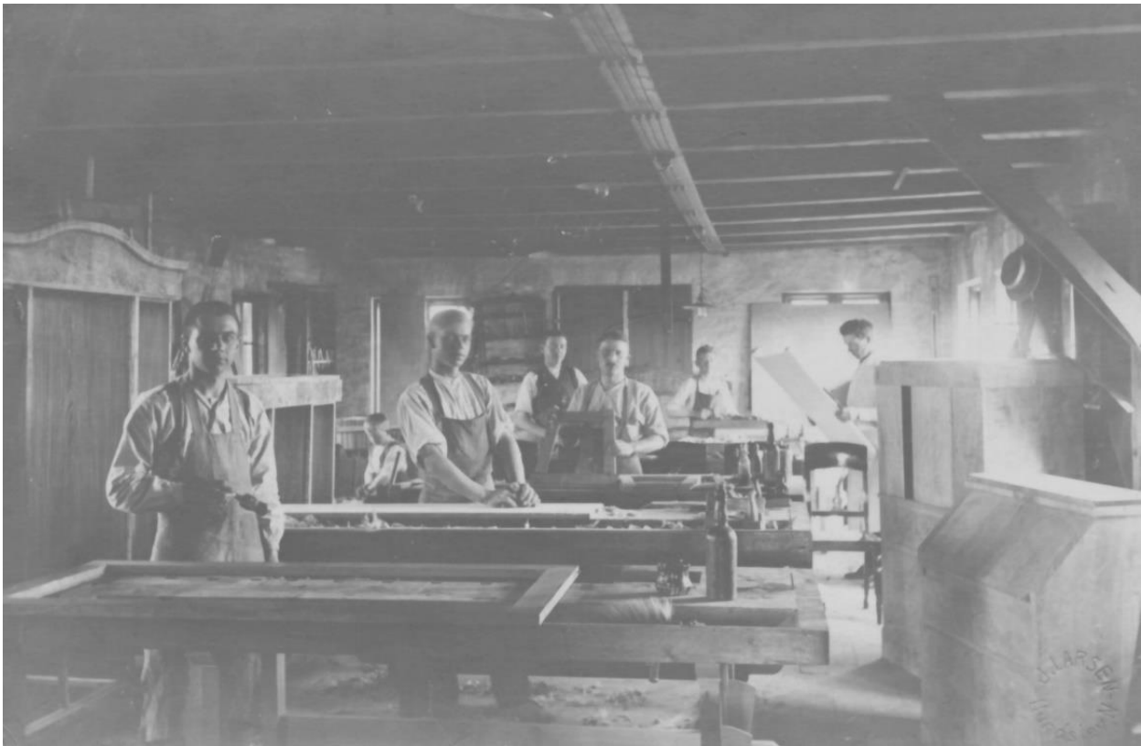
Travlhed hos de mange svende og lærlinge på snedkerværkstedet i Dræby