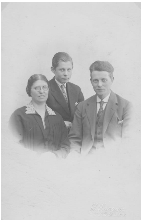
Snedkerfamilien omkring 1924