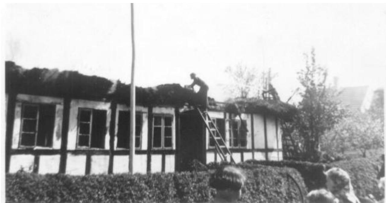
Brandtomten i Nørregade

Ejeren var kort tid inden branden blevet tilbudt 500 kr. for sin ejendom, men brandforsikringen gav noget mere, nemlig 3.000 kr. Hvorvidt det kunne dække opførelsen af et nyt hus, var dog mere end tvivlsomt.