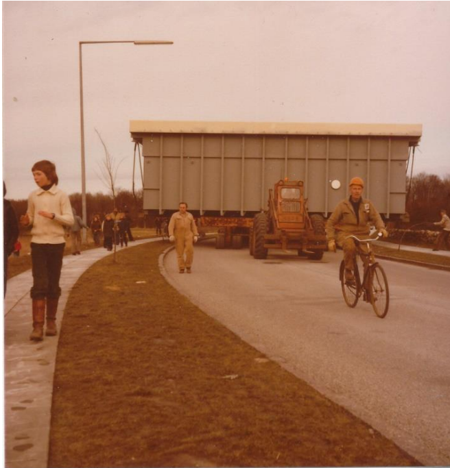
Bycentervej er bred, men der var alligevel brug for hele bredden, da man 18. marts 1978 skulle transportere bassinet fra Lindø til svømmehallen Mosevangen.

Resolutionen, der blev vedtaget, var skarp. Blandt andet udtrykte man skarp misbilligelse af, at ingen af sognerådets medlemmer mødte op, og man stillede krav om, at