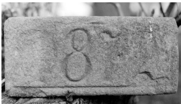
Fundamentsten med årstallet 1872, som opbevares ved den tidligere møllerbolig.