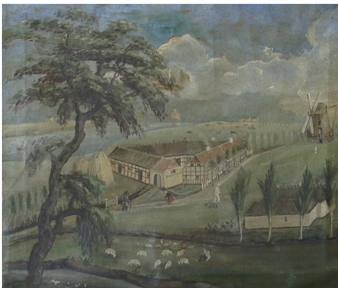
Øverst: Et smukt foto af møllen formentlig fra 1940'erne. Nederst: Et festligt amatørmaleri fra omkring 1920 af ukendt kunstner, som har digtet forskellige aktører bl.a. en hvidklædt møller ind i billedet.