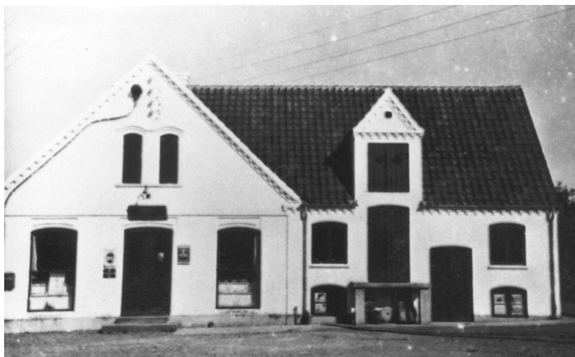
Dræby Brugs i 1920erne med platformen til højre