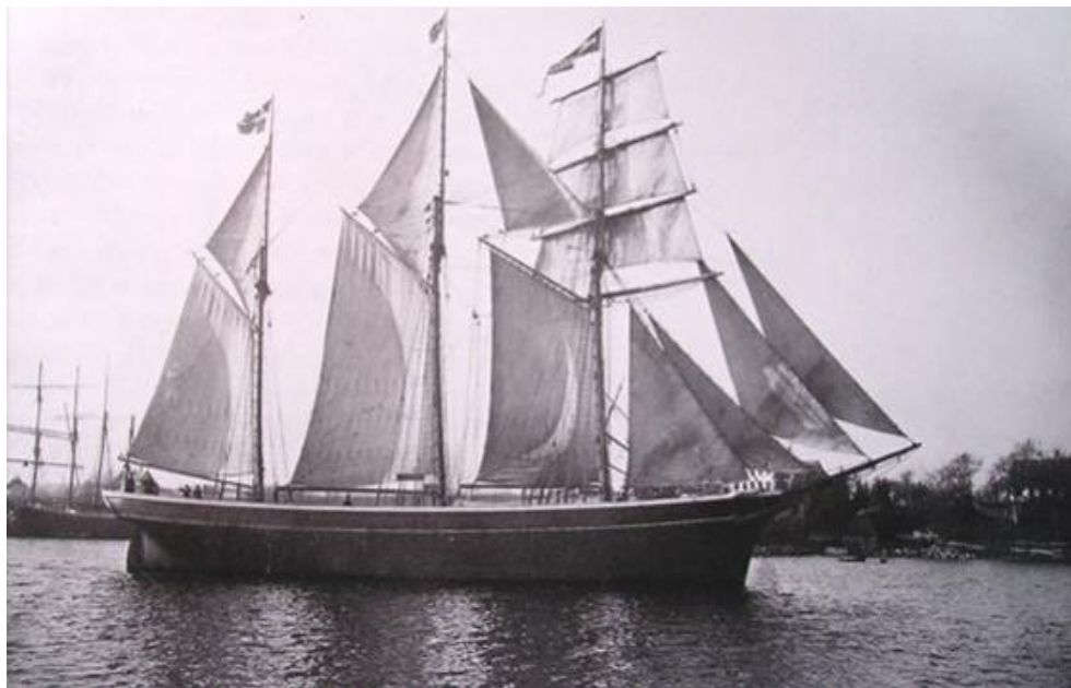
Bramsejlskonnerten "Martin Nisson".