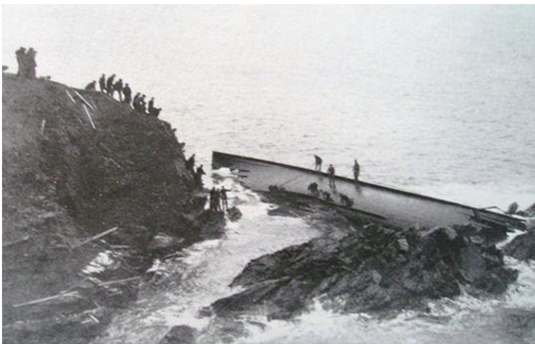
Vraget på klipperne ved Dunrossness.

Ingen overlevende kunne altså fortælle hvad der var gået galt. I det efterfølgende søretsmøde bemærkede et af dens meget søkyndige medlemmer at han ”kendte skibet særdeles godt og anså det for at være et fuldt ud godt skib”. Han kunne ikke tænke sig anden årsag til forliset end at det var kæntret i Nordsøen i den hårde juleorkan. Skaden for og agter fik det antagelig først ved grundstødningen mod klipperne.