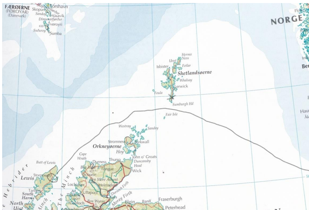
Skonnertens formodede sejlroute. Krydset markerer, hvor vraget skulde i land.