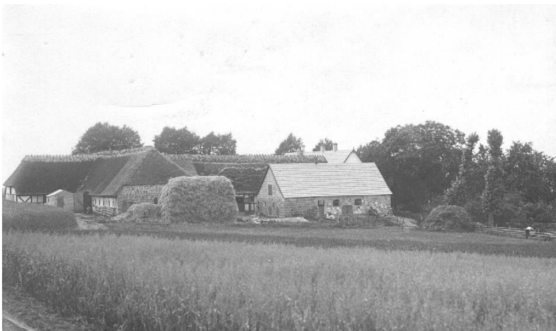
Munkebo Skovgård ca. 1920