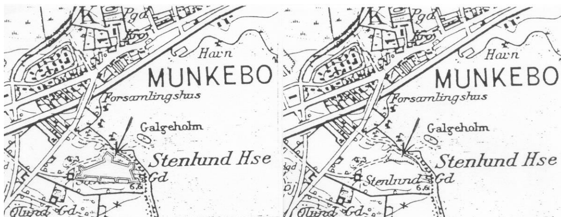
I Pufendorfs værk 1696 om kong Karl Gustavs bedrifter ses en tegning af Nyborgs stjerneskanse, som på kortet til venstre er indsat på stedet for Munkebos. Til højre: skanseresten som opmålt af Geodætisk Institut 1863 og endnu synlig i 1958, jf. luftbilledet. Også vest, syd og øst for signaturen anes det oprindelige anlæg. Det store K er Munkebo Kirke.