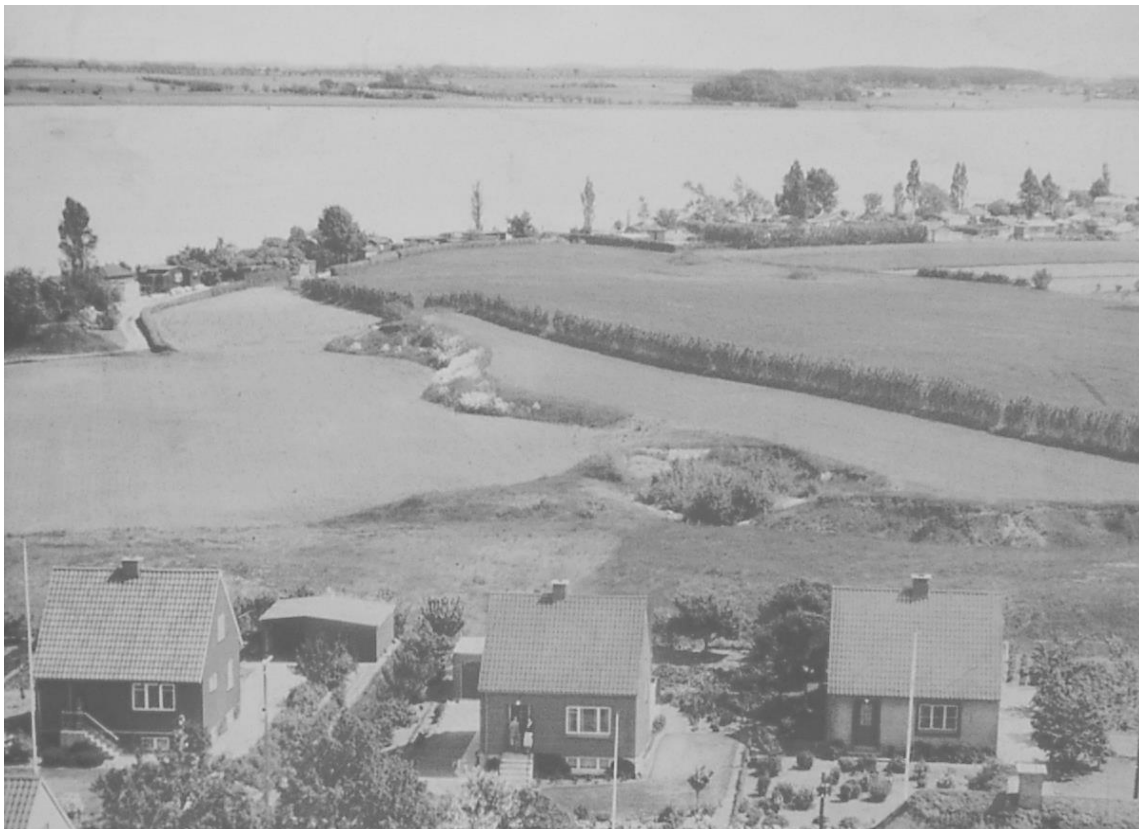
Luftbillede af Syvstjernen 12-16 fra omkring 1958. Bagved: Resterne af svenskernes stjerne-skanse, opført 2.-5. november 1659.