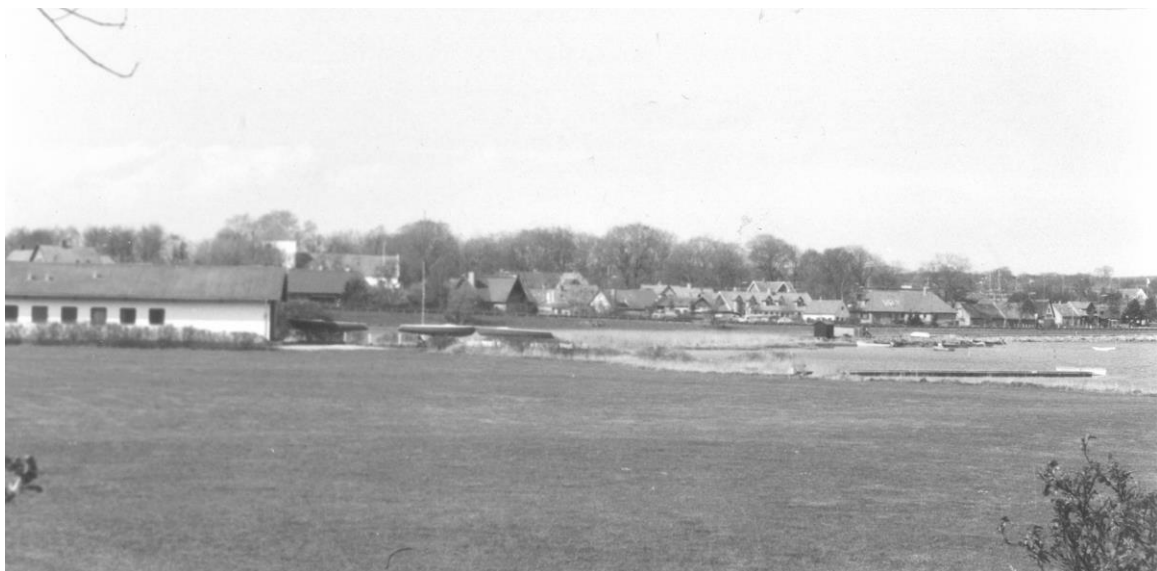
På Maen – engen foran i billedet – var det, at svenskerne havde håbet på deres rytterslag. – Foto 1988 fra nordlige skanseside med udsigt mod kirken "tværs overfor".