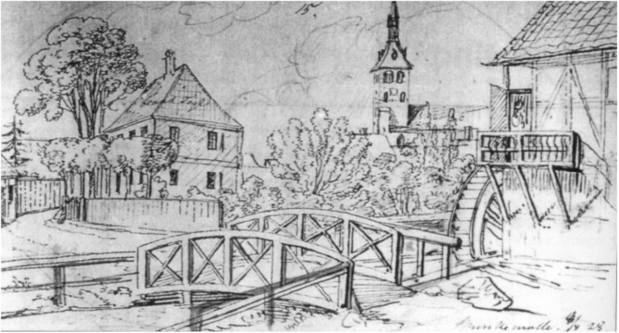
Den gamle Munke Mølle, her tegnet af J. H. T. Hanck, H. C. Andersens gode ven, 1828. Til venstre udmundingen af Munkemøllestræde, hvis store hus ved den tid var møllerens beboelse. Vandet under broen er MALEKARMEN, der førte den nordlige arm af åen frem mod møllehjulet.